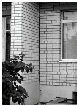
Рис. 4. Раскрывшийся ТДШ