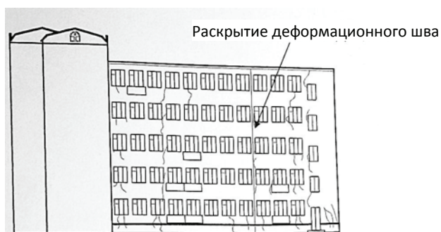
Рис. 10. Трещины в стенах: a – ул. Гоголя, 14; б – ул. Рыльева, 70