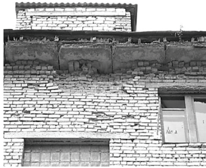
Рис. 8. Разрушение кирпичной кладки под карнизными плитами

Четырехэтажное здание по ул. Советской, 194 Л. Наиболее разрушена кирпичная кладка стены в районе водосточной трубы. Наружные слои кладки разрушены на глубину до 200 мм (рис. 9). Причиной разрушения кладки явилась неудовлетворительная эксплуатация здания.