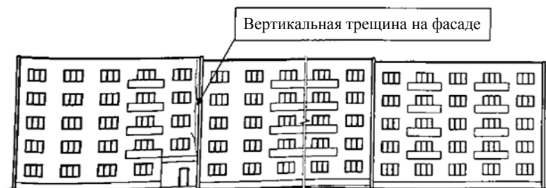
Рис. 2. Западный фасад здания

В течение 14 лет на кафедре «Конструкции зданий и сооружений» ТГТУ ставились многочисленные опыты с моделями стен, изготовленными в виде бетонных и железобетонных пластин. Оценивались влияния различных дефектов: отклонение от проектного положения; частичное симметричное и несимметричное опирание; наличие трещин с различными параметрами (относительная длина, ширина раскрытия, направление, расположение и частота); наличие проемов разных относительных размеров и др. Изучалось влияние схем нагружения (одноосное, двухосное), граничных условий (свободное опирание, защемление с двух и четырех сторон). Целью экспериментов являлось: определение функциональных зависимостей между величинами