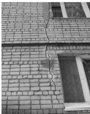
Рис. 11. Дефекты и повреждения дворового фасада дома: a – трещины в стенах; б – раскрытие деформационного шва