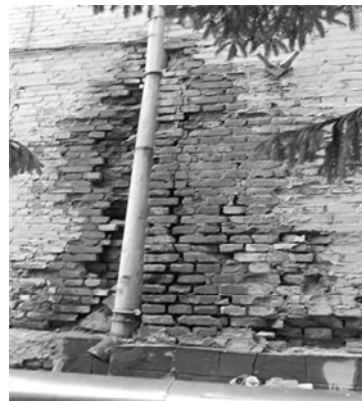
Рис. 9. Разрушение кирпичной кладки в районе водосточной трубы

Кирпичное здание ДЮСШ № 3 по ул. С. Ценского, 2. Фундаменты – кирпичные ленточные. Здание трехэтажное с подвалом и чердаком размерами в осях 34,1×46,6 м, сблокированное с рядом стоящим посредством переходной галереи. Галерея примыкает к обследуемому объекту в уровне второго этажа и располагается на отдельно стоящих опорах.