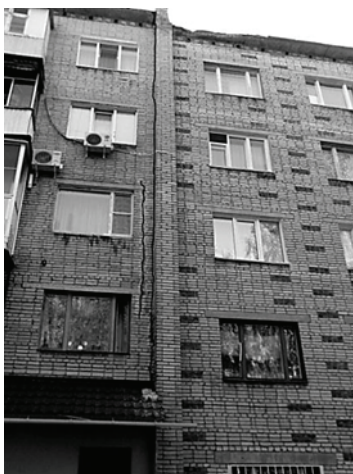
Рис. 1. Трещина на западном фасаде

чинами разрушающих нагрузок и параметрами деформации и разрушения. Некоторые результаты исследований приведены в работе [10]. Крупные экспериментальные исследования проведены Н. Н. Ласьковым [6].