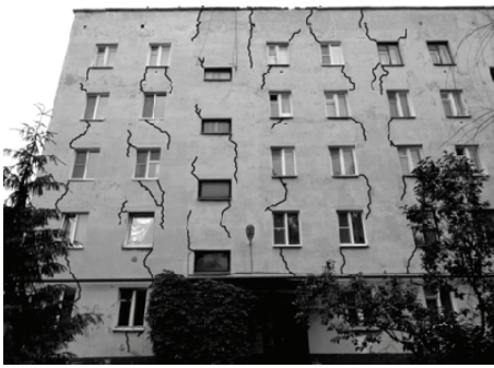
Рис. 7. Восточный фасад здания